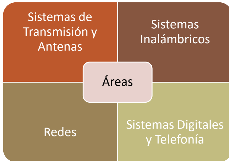
Figura 1. Áreas que serán evaluadas

El Examen de Grado será estructurado sobre las áreas que se presentan en la Figura 1. Las asignaturas que conforman las áreas a evaluarse se presentan en la Figura 2, que corresponden a materias obligatorias que forman parte del pensum actual de la Carrera. Las temáticas correspondientes a las distintas asignaturas se presentan en la Tabla 1.